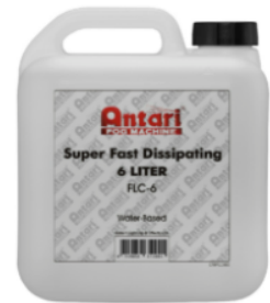
選配 FLC-6 快速消散煙霧水