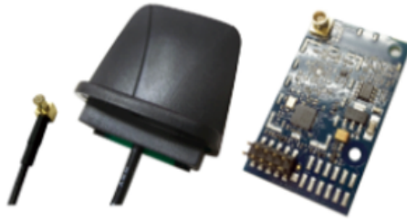
選配 W-DMX-PCBR W-DMX PCB+天線