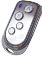
標配 W-2 無線控制模組